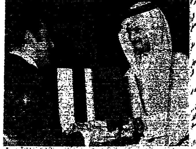
الوزير السعودي للشؤون الخارجية للشؤون الخارجية بكتف السخر الخلفي في جده يوم الجمعة ١٠ أيار ١٩٧٥

أكد وزير الدولة السعودي للشؤون الخارجية، أن موقف بلاده من قضية القدس لم يطرأ عليه أي تغير... فالقدس يجب ان تعود عربية وستظل عربية، والقوة لا يمكن ان تحل محلها أو تعطي صفة الشرعية.